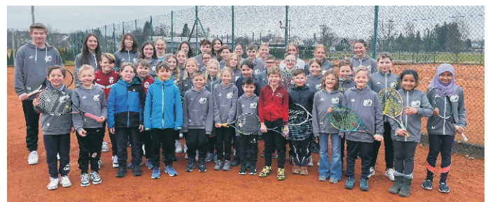
Fast 80 aktive Kinder und Jugendliche bilden den sportlichen Unterbau der Offinger Tennisabteilung