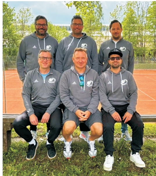
Die Herren 40 bleiben in der Südliga 1 leider weiter ohne Sieg.