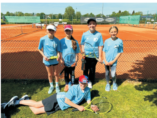
Nicht gewonnen - aber nicht schlimm! Unsere Bambinis hatten trotzdem viel Spaß bei den Matches gegen den FC Gundelfingen.