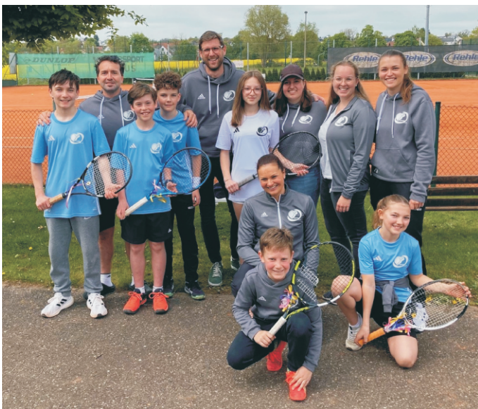
Endlich wieder Tennis am Mindelbogen. Mitglieder allen Alters freuen sich auf die neue Spielzeit beim TSV Offingen.

Sonntag, 05.05.; 15:00 Uhr Midcourt U10 I - VfL Leipheim SC Bonstetten - Midcourt U10 II